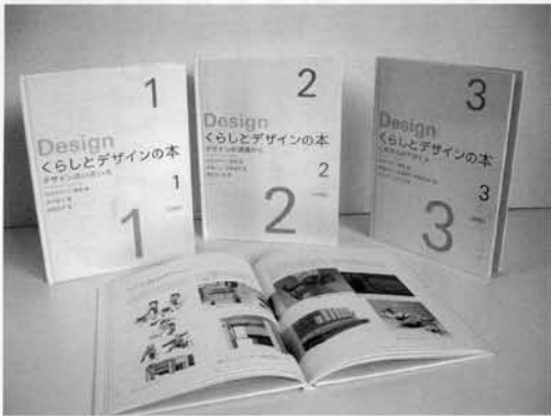
全3巻 揃定価 10,080円 (揃本体 9,600円) 各巻 3,360円 (本体 3,200円) A4変形版 28×21cm 56～66ページ

子ども向けの文章づくりは難しく、大人のことばや専門用語で言い抜けられないことが多々あります。そのため、概念や論旨を深掘し、それを子どもに伝わる表現にして埋めめもどす。私自身に