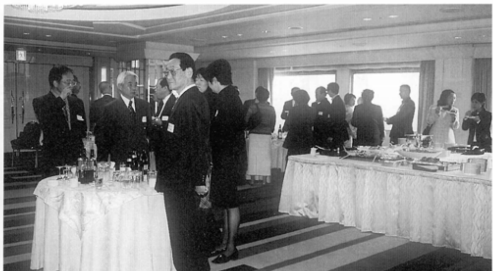
P4 平成十五年十一月二十二日 中野サンプラザ